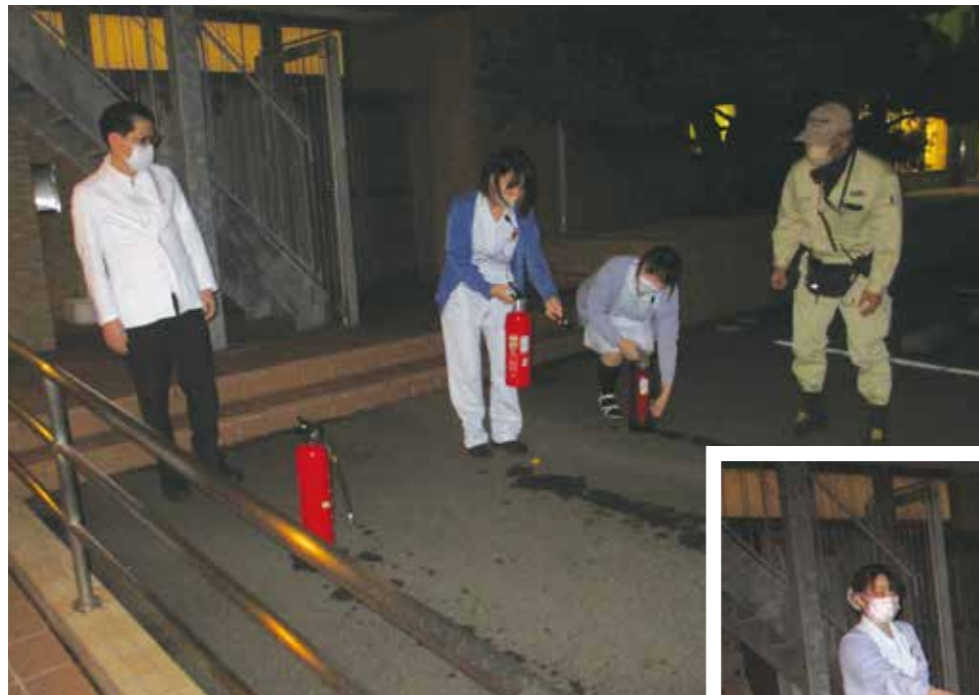
▲ 消火器の訓練です。消防団の方が消火器の取り扱いを丁寧に教えてくれています。

毎年行っている防災訓練ですがスタッフ同気を引き締めて行っております。 災害時はスタッフが誘導しますのでご協力をお願いします。