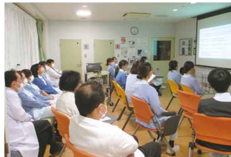
▲ 全員で集合して避難経路の確認や、災害発生時のスタッフの動きの確認を行いました。